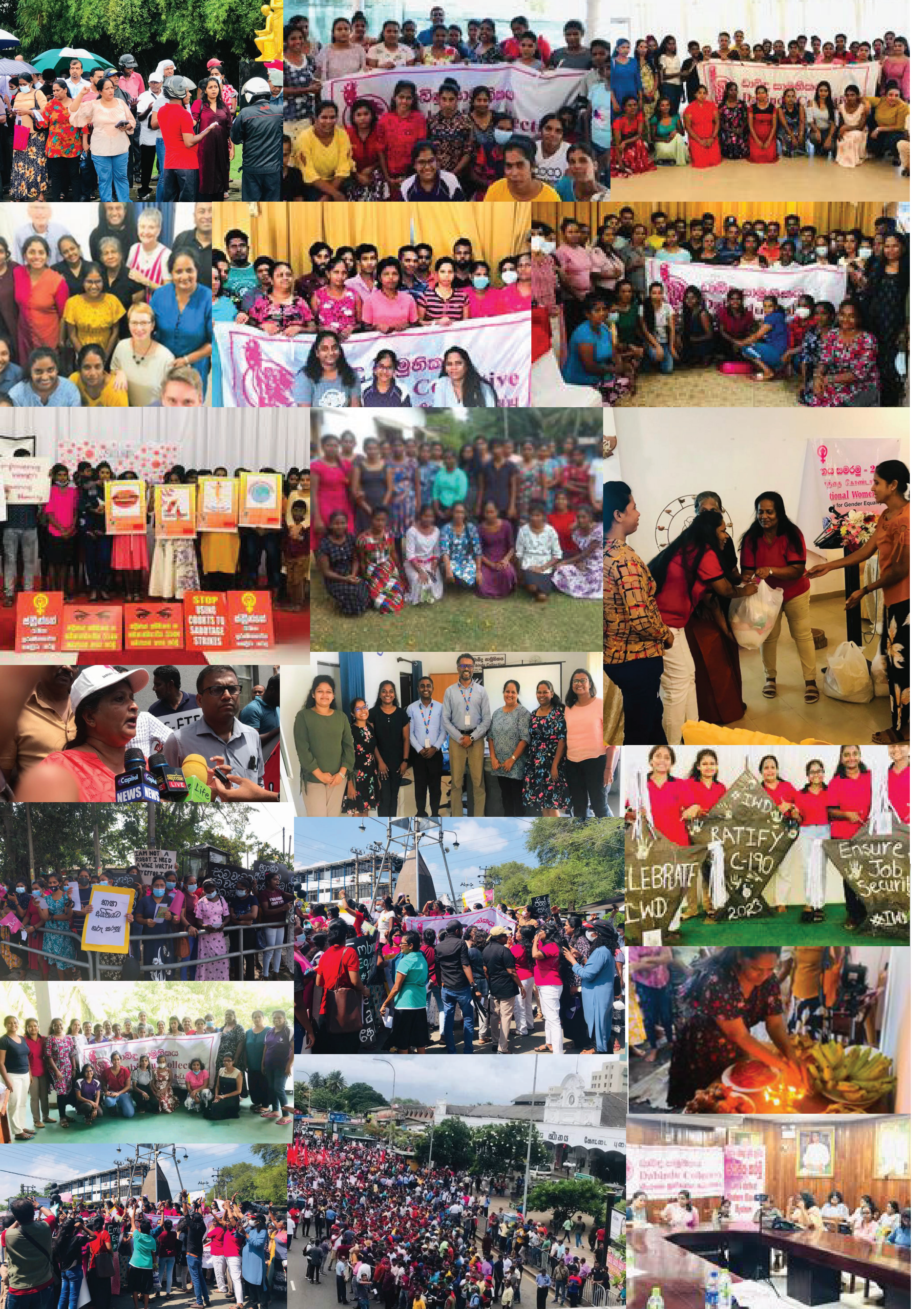
இல, 221, வெலபட வீதி, கட்டுநாயக்கவை வசிப்பிடமாகக் கொண்ட எச்.ஐ.சமன்மலி ஆகிய என்னால் ரத்வெகி அச்சகத்தில் அச்சிடப்பட்டது.